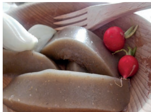
Kyselice z kapřích šupin