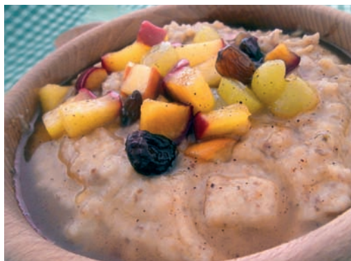
Kaše z mléka kaprového

dá z kapra uvařit. Byl jsem požádán udělat podobnou akci v Letinech u Nepomuka. Práce mě stále baví a po příjemných ohlasech na moji rybí kuchařku a žádostem o pokračování jsem začal připravovat scénář nové knihy. Chci se v ní věnovat a představit techniky přípravy studené i teplé kuchyně se vzorovými recepty. Chci větší pozornost věnovat kapru, vysoce kvalitní biopotravině, která je stále podceňována jak širokou veřejností, tak i kuchaři profesionály. Půjde-li vše dle předpokladů, kniha by měla být vydána na podzim 2021.