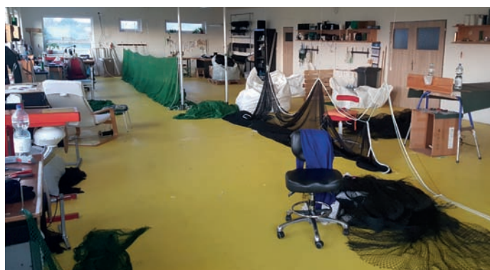
Pohled do síťářské dílny

hraničních veletrhů a propagovali českou řemeslnou zručnost a teprve nyní sklízí plody své dlouhodobé a náročné práce. Dnes společnost vyváží nářadí a sítě do osmi zemí v Evropě, mimo jiné i do Norska, Švédska i Dánska. Na tamních trzích uspěla s vysokou kvalitou výrobků i velmi širokým sortimentem materiálů pro výrobu. Vždyť při téměř 60 druzích sítovin skladem doká-