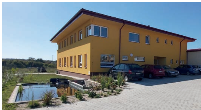
Nové sídlo společnosti

Ačkoliv se společnost, jak pan Dobeš přiznává, pokoušela dlouhodobě prosadit i na zahraničním trhu, tohoto úspěchu dosáhla až před pěti lety. Mnoho let se zástupci společnosti účastnili za-