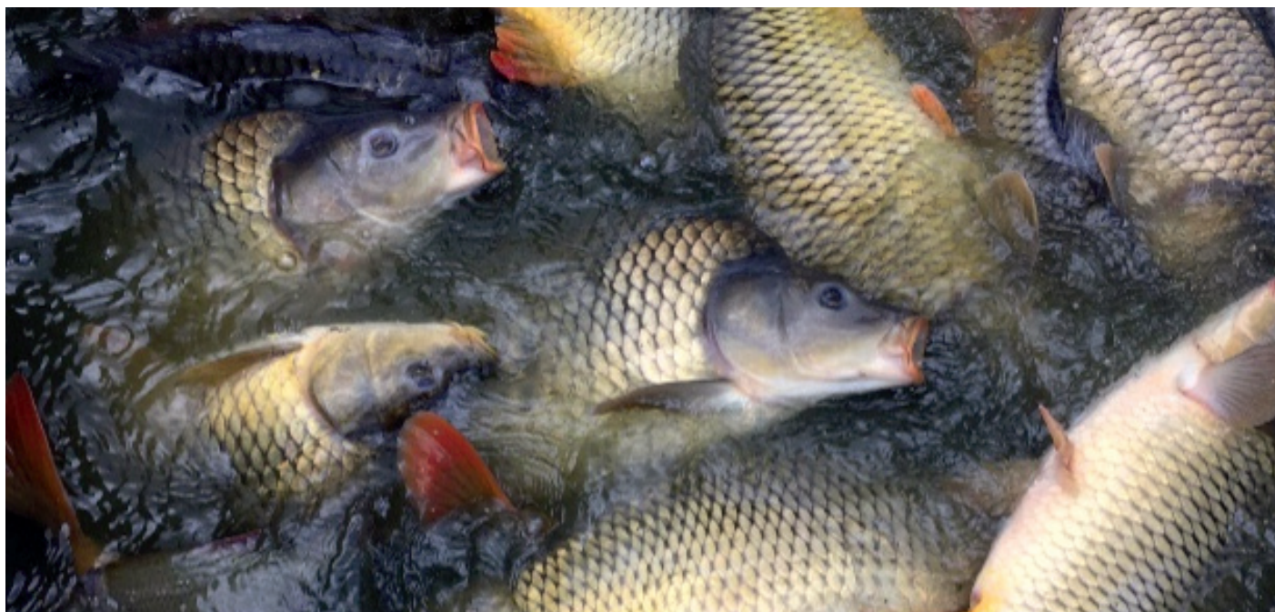
Kapř obecný ( Cyprinus carpio )